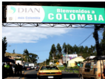
Paso de Frontera Internacional – Puente de Rumichaca. Colombia – Ecuador

A través de este artículo se plantea el funcionamiento en cuanto a la logística y gestión empresarial que manejan: La DIAN, Bodegas Asociadas S.A y Zona Franca Alimentos Nariño. Donde nos pudimos dar cuenta que Ipiales ya no es una zona solo dedicada al cultivo, si no que debido a su ubicación en la frontera se volvió una zona muy propicia para los negocios internacionales, esto ha llevado a una competitividad regional que crea las condiciones del territorio como un entorno favorable para que las empresas crezcan, aunque de la misma manera muchas otras se ven afectadas debido a la globalización.