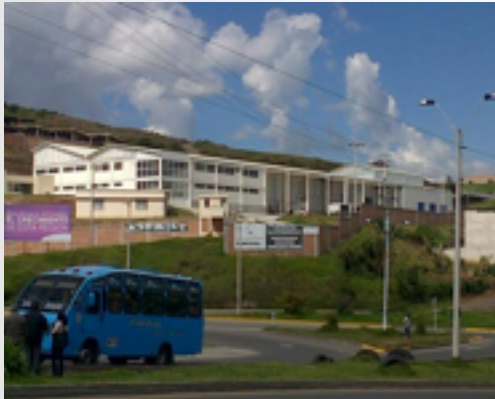
Zona franca de alimentos Nariño – Ipiales

De lo anterior se podría concluir que hay muchos beneficios en cuanto al comercio internacional, pero también hay muchas desventajas para las empresas que no logran superar estos cambios y por lo cual dejaron de funcionar.