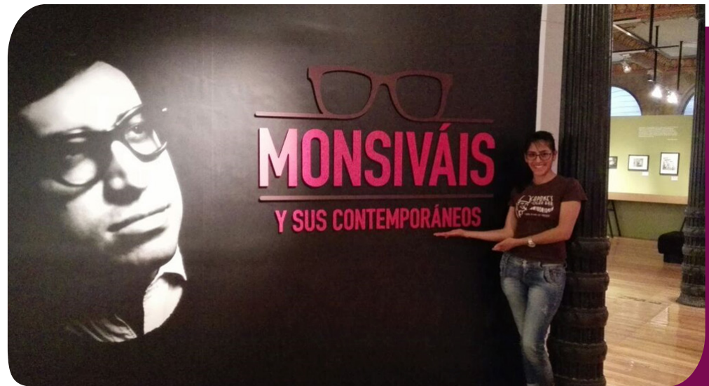
Universidad Autónoma San Luis de Potosí (México)

Aplicaciones con documentación incompleta NO serán tomadas en cuenta.